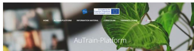
Abb. 1. Homepage – „AuTrain-Plattform“ ( www.austrain.eu ).

Dazu wurde eine Online-Plattform entwickelt, die zunächst allgemeine Informationen zu ASD präsentiert. Zweitens enthält die Plattform alle notwendigen Lehr- und Schulungsmaterialien, die für den von einer externen Akkreditierungsstelle nach ISO 17024 zertifizierten Ausbildungsgang „Autismusbeauftragte/r“ notwendig sind.