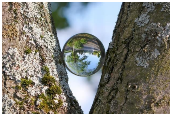
Abb. 5. Einblicke in eine „fremde“ Welt.