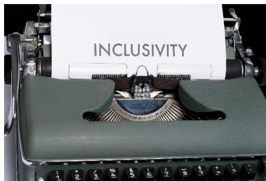
Abb. 7. Soziale Inklusion ist mehr als nur eine Phrase.

Video: „CBS-Sunday Morning – Hiring autistic workers“