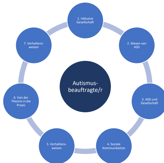
Abb. 3. Struktur der Ausbildung „Autismusbeauftragte/r“ – vereinfachte Darstellung (eigene Darstellung).

Für Kursteilnehmer/innen ist die Teilnahme an jedem Modul Pflicht. Wie Abbildung 3 zeigt, sind alle Module miteinander verbunden, um das Wissen, die Erfahrung, die Reflexion und die Kompetenzen aus einer menschlichen, positiven, ökologischen und integrativen Perspektive zu verbessern.