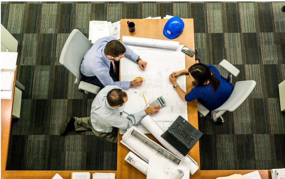
Abb. 8. Verbreiten Sie soziale Inklusion in ihrem privaten und beruflichen Umfeld.