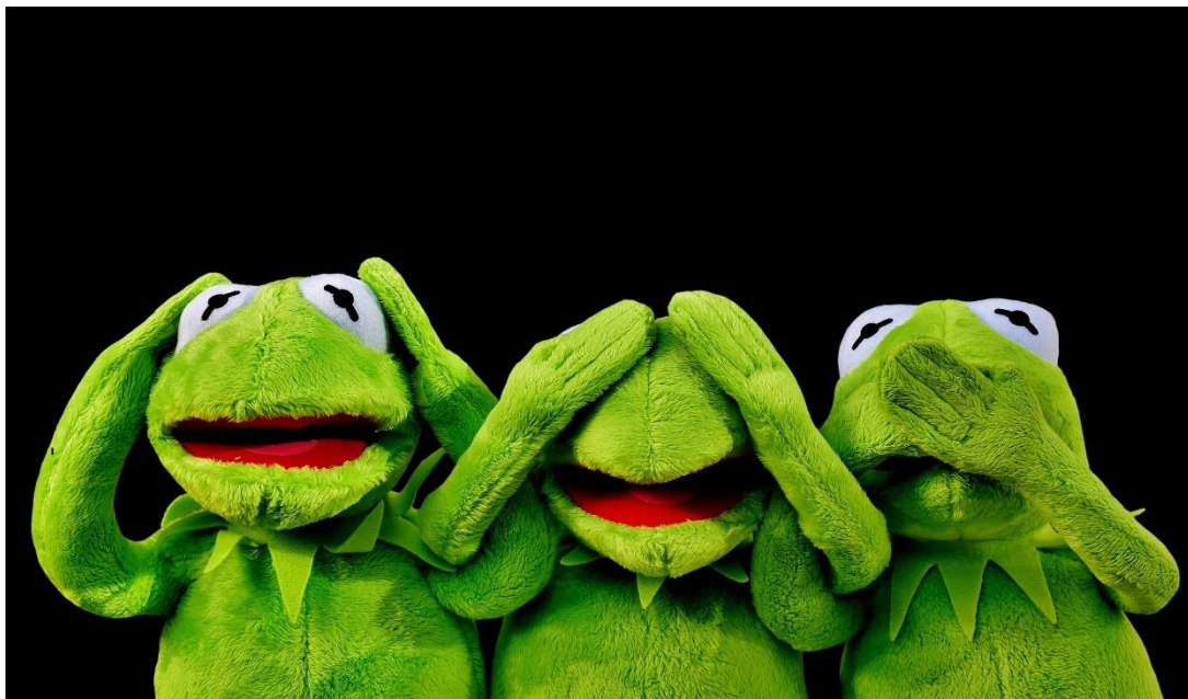
Abb. 6. Mit Sicherheit der falsche Weg in der Kommunikation.