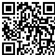
Abb. 2. QR-Code AuTrain Plattform (eigene Darstellung).

Alle Aktivitäten sind auch Teil der Online-Version und alle Inhalte sind auch auf der AuTrain-Plattform zu finden: https://www.autrain.eu/autrain-platform/